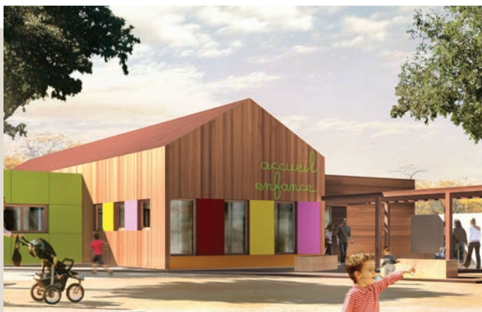
Construction neuve - Ossature bois - Visuel du projet