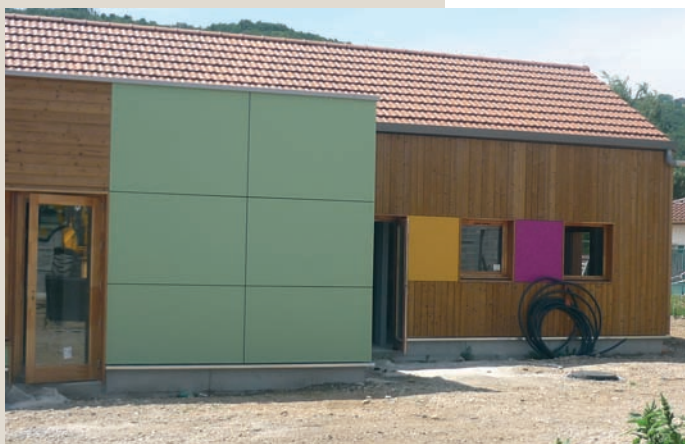
Photos de l'avancée des travaux