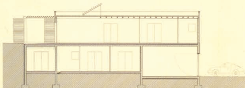
▼ Coupe longitudinale nord-sud.