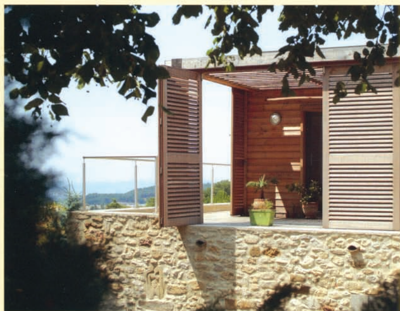
▲ Une succession de volets persiennés module l'ouverture de la terrasse.