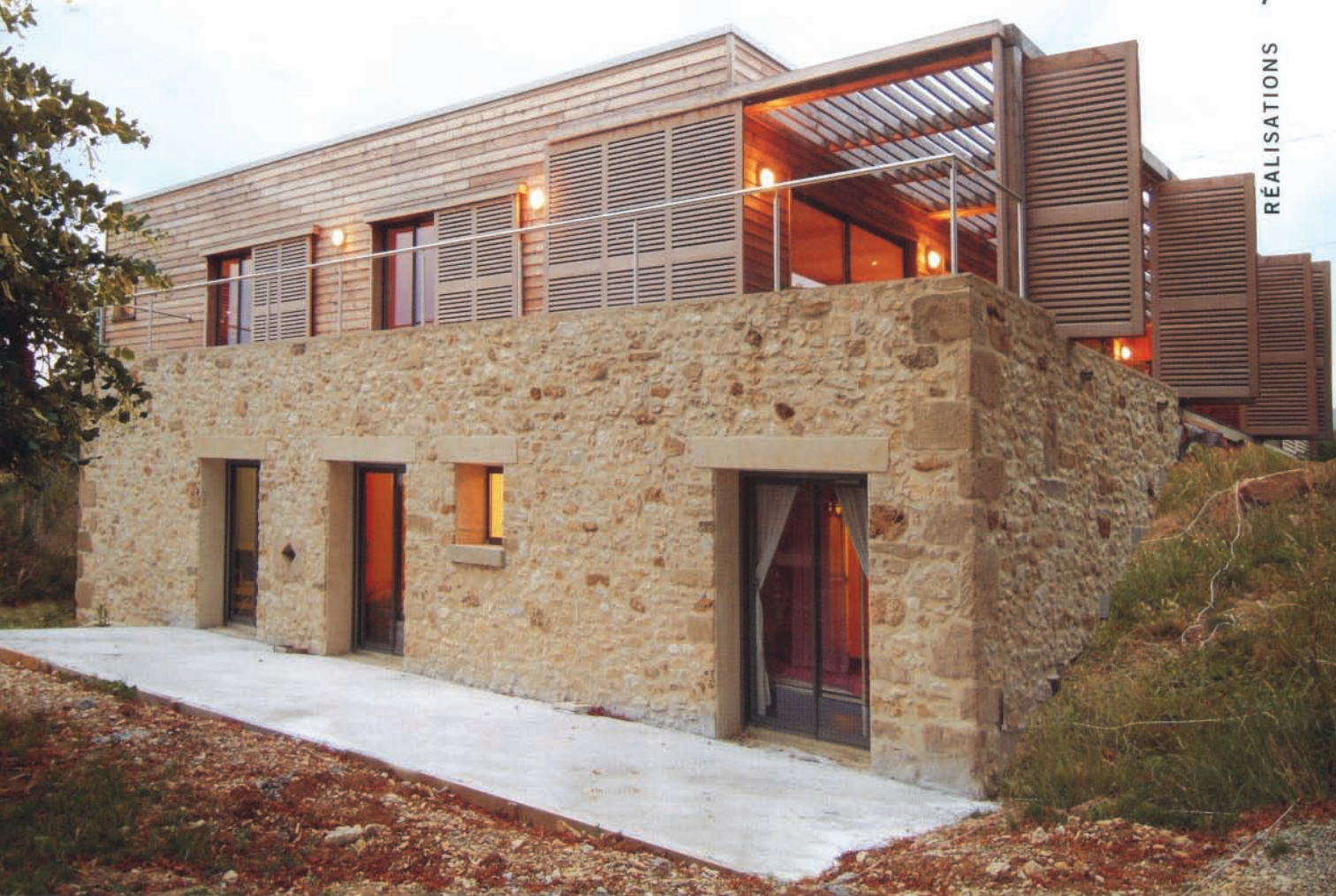
▲ Un socle en maçonnerie partiellement engagé dans la pente sert d'assise à la construction à ossature bois.