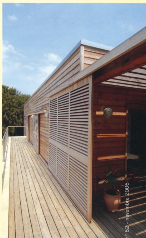
▲ Clins horizontaux du bardage en mélèze, lames et écrans de la terrasse composent des modénatures variées.